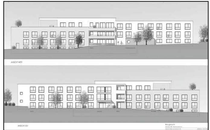
Ansichtsskizzen West und Ost des geplanten Pflegeheimes

Der Wunsch nach einem Seniorenzentrum mit Pflegeplätzen und betreutem Wohnen südlich der Frühlingstraße besteht in der Gemeinde anhaltend. Der Gemeinderat stimmte in der vergangenen Sitzung einem wichtigen, nächsten Planungsschritt zu.