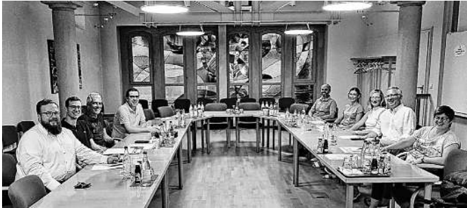
Die Bürgermeister aus Heiningen, Dürnau, Eschenbach und Gammelshausen (v. l. n. r.) sowie die Ärztinnen und Ärzte aus Heiningen und Dürnau sowie Vertreter des Gesundheitsamtes Göppingen