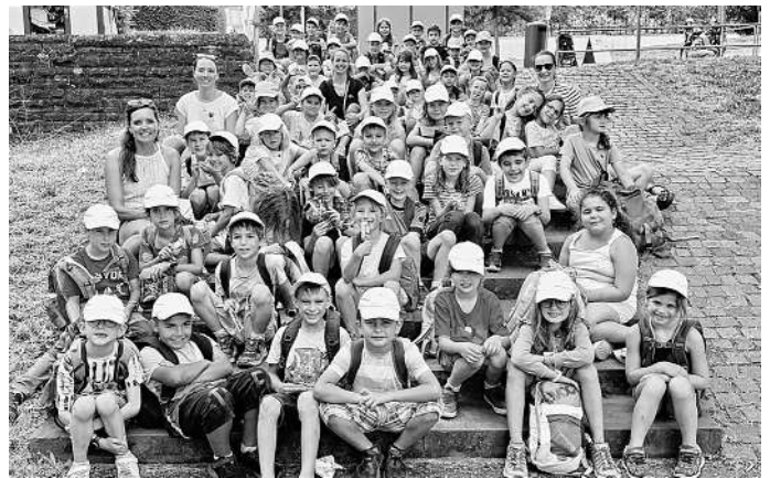
Klasse 1a – c

Am Donnerstag, den 3. Juli, durften die Kinder der drei ersten Klassen der Albert-Schweitzer-Schule in Albershausen einen tollen Ausflug erleben. Schon früh morgens machten wir uns auf zum Bahnhof in Ebersbach. Von dort aus fuhren wir mit Zug und U-Bahn zum Höhenpark Killesberg. Nach einer ersten Stärkung ging es erst einmal zu den Ziegen, Eseln, Enten und Flamingos, die wir auch füttern konnten. Anschließend gingen wir weiter zum Theater in der Badewanne. Dort lauschten wir gespannt den Erzählungen vom „tapferen Schneiderlein“ wie es von einem einfachen Schneider zu einem König wurde. Nur mit Hilfe von Handpuppen, verschiedenen Requisiten und durch lustige Stimmveränderungen begeisterte der Schauspieler die Kinder. Nach dem Theaterbesuch bestiegen wir mutig den 42 Meter hohen Killesbergturm und bestaunten die tolle Aussicht über Stuttgart und die Umgebung. Auf dem Spielplatz hatten wir dann viel Zeit zum ausgelassenen Toben und Spielen. Als kleinen Energieschub durften wir uns dann auf dem Jahrmarkt etwas Kleines kaufen. Eis, Popcorn und weitere Leckereien versüßten uns den Nachmittag. Weiter gingen wir zur Killesbergbahn und drehten eine Runde durch den Park. Bei diesem schönen Abschluss fuhren wir noch einmal an allen Stationen des heutigen Ausflugs vorbei. Mit vielen tollen Erlebnissen im Gepäck sind wir am späten Nachmittag wieder in Ebersbach angekommen.