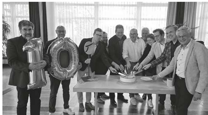
Albtraufgänger-Bürgermeisterinnen und Bürgermeister beim Tortenanschnitt bei der jüngsten Mitgliederversammlung in Donzdorf

Zum 10-jährigen Jubiläum ist ein gemeinsamer Rückblick mit Wanderfreunden, Wegbegleitern und Verantwortlichen geplant. Der Albtraufgänger ist mehr als nur ein Wanderweg – er ist ein Symbol für nachhaltigen Tourismus, regionale Zusammenarbeit und die Schönheit des Albtraufs.