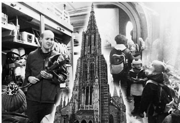
Der Ausflug ging zur Feuerwehr in Dürnau und nach Ulm

„SMS – Schule mit Spaß“ Förderverein der Grundschule Dürnau-Gammelshausen