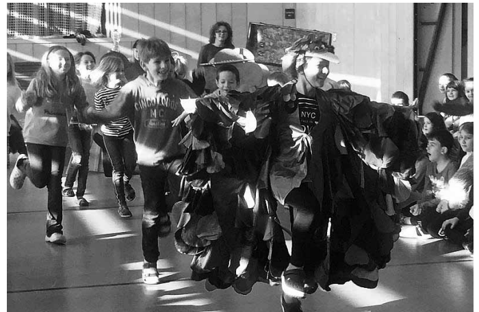
Der Vogel fliegt mit seiner Vogelschar durch die Lüfte.