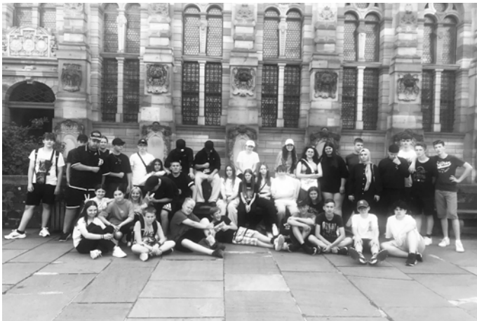
Klasse 8a und 8b

Schullandheim mit den Klassen 8 der Albert-Schweitzer-Gemeinschaftsschule in Heidelberg