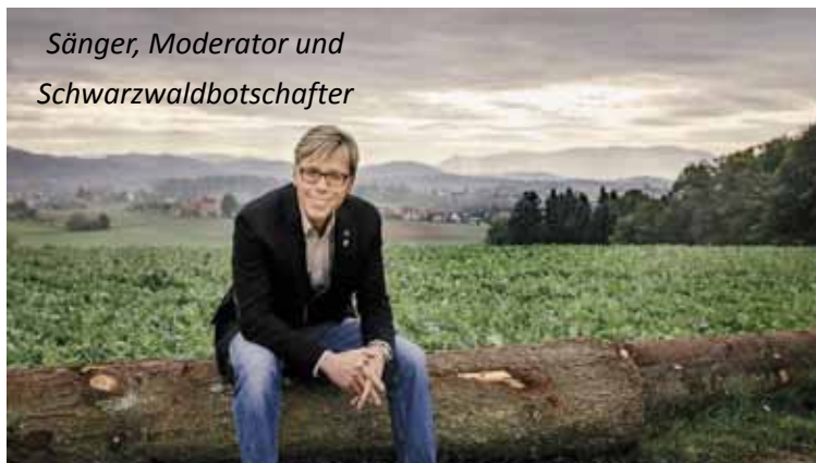
Sänger, Moderator und Schwarzwaldbotschafter

Eintritt: 28 € (inkl. 1 Freigetränk!) Einlass: 18:30 Beginn: 19:30