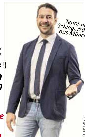
Tenor und Schlagersänger aus München

Vorverkaufsstelle im Rathaus Gammelshausen