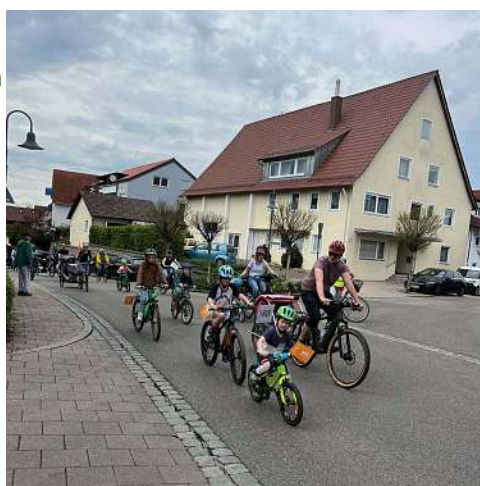
Kidical Mass 2023 in Bad Boll

Wir fordern ein kinderfreundliches Straßenverkehrsrecht, denn das ist Voraussetzung für sichere und selbständige Mobilität (nicht nur) der Kinder. Wir wollen, dass sich alle Kinder und Jugendlichen sicher und selbständig mit dem Fahrrad bewegen können. Dafür braucht es sichere Fahrradwege, ein durchgehendes Radwegenetz und Tempo 30 als Regelgeschwindigkeit.