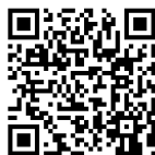
QR-Code Meine Umwelt-App

Weitere Informationen zur Asiatischen Hornisse und wie sich die Art von heimischen Insekten unterscheiden lässt finden sich auf der Homepage der LUBW https://www.lubw.baden-wuerttemberg.de/natur-und-landschaft/asiatische-hornisse sowie auf der Homepage der Landesanstalt für Bienenkunde der Universität Hohenheim unter https://bienenkunde.uni-hohenheim.de/vespavelutina . Dort finden sich auch weitere Informationen, wie Bürgerinnen und Bürger aktiv bei der Suche nach Tieren und Nestern mitwirken können. Seit April 2024 koordiniert die Landesanstalt für Bienenkunde in Stuttgart-Hohenheim im Auftrag der Naturschutzverwaltung das landesweite Management der Asiatischen Hornisse (Kontakt siehe Homepage).