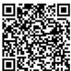
QR-Code Meldeplattform Asiatische Hornisse

Um möglichst rasch Maßnahmen zum Fang der Königinnen und Beseitigung der Nester der Asiatischen Hornisse zu veranlassen, bittet das Ministerium für Umwelt, Klima und Energiewirtschaft um Meldung von Sichtungen in Baden-Württemberg. Dies ist über die Meldeplattform auf der Homepage der Landesanstalt für Umwelt (LUBW), aber auch über die kostenlose „Meine Umwelt-App“ möglich: