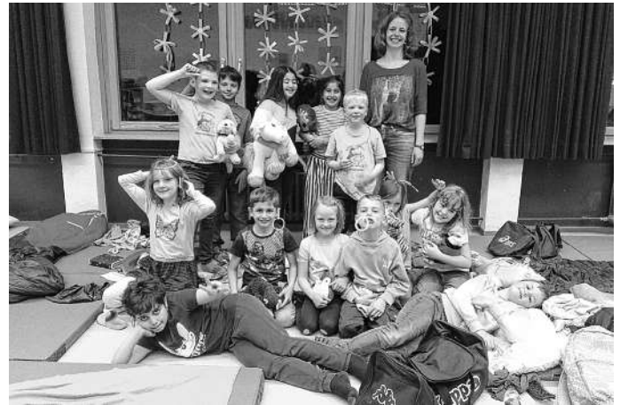
fröhliche Gesichter nach unserer Tanzparty

Schon seit der Ankündigung, dass es eine Lesenacht kurz nach den Osterferien geben wird, waren die Schülerinnen und Schüler der Klasse 2b aus dem Häuschen. Während die Spannung und Vorfreude von Tag zu Tag stiegen, sammelten wir gemeinsam Ideen, was wir an dem Abend alles machen wollen.