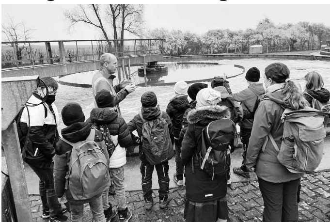
Klasse 4b besichtigt die Kläranlage in Bad Boll