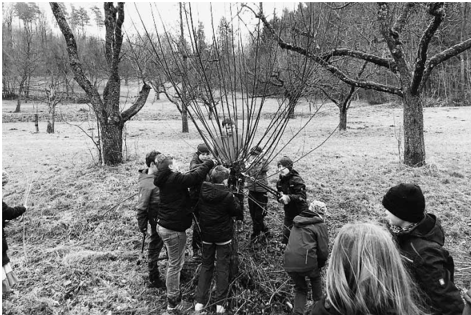
Klasse 4b pflanzt einen Apfelbaum.