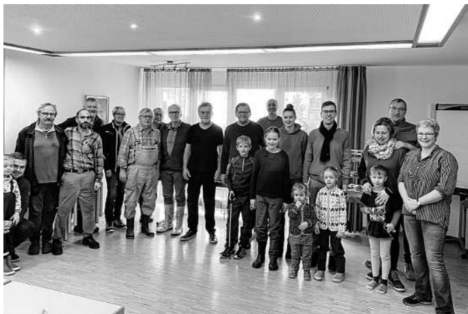
Ein Teil der Helferinnen und Helfer beim gemeinsamen Vesper und Austausch in der Begegnungsstätte

Getreu dem Motto „Erst die Arbeit – dann das Vesper“ trafen sich die Helferinnen und Helfer im Anschluss an die Putzete in der Begegnungsstätte „Treffpunkt“ zu einem gemeinsamen Umtrunk mit Vesper.